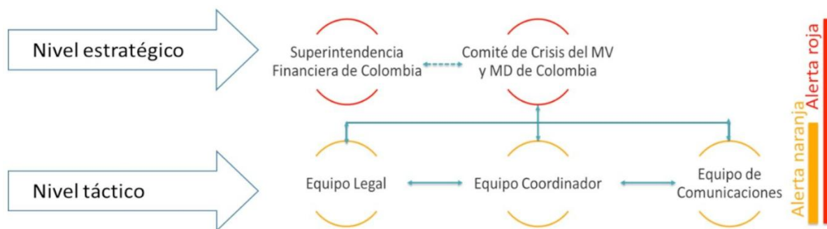
Gráfico 1 - Estructura de Gobierno

En los órganos de gobierno participan los funcionarios designados por cada uno de los proveedores de infraestructura que son parte de este Protocolo. Según lo estimen necesario o conveniente, los órganos de gobierno del Protocolo podrán invitar a personas externas, asesores, o representantes de terceros, incluyendo los MAPs.